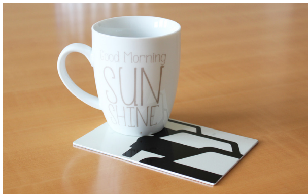
Bei Stau bitte Tasse abstellen.

Sie haben eine Karte aus unserer Serie Send a Sign bekommen und finden diese zum Entsorgen zu schade? Hier haben wir einige Anregungen, wie Sie die Karte weiter verwenden können. Natürlich sind wir auch auf Ihre Lösungen gespannt und freuen uns über Ihre Rückmeldung. Viel Vergnügen beim Up- vom Recycling!