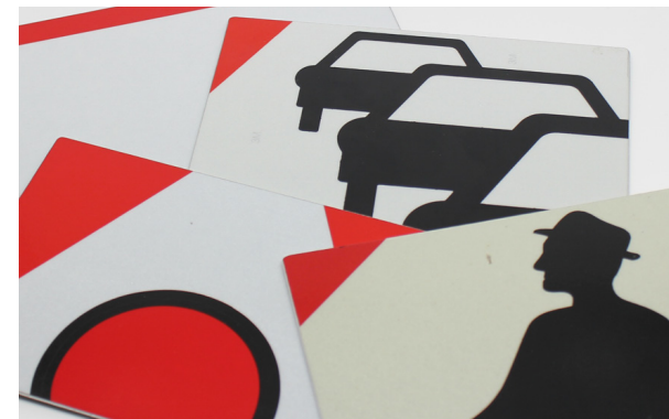
Hier ist Platz für Ihre orginnelle Idee.