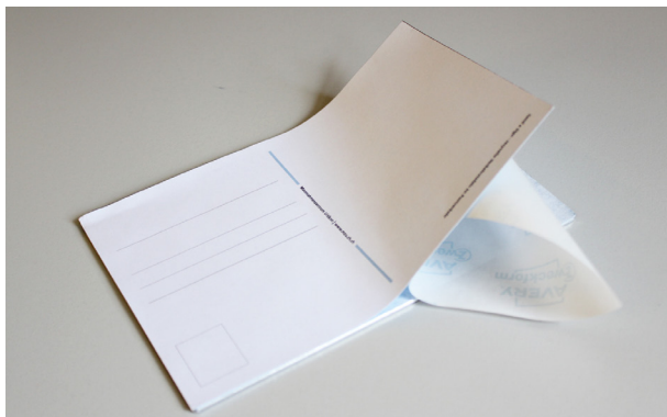
Auf Seite 3 gibt es die Vorlage für einen Weiter- versand der Karte.