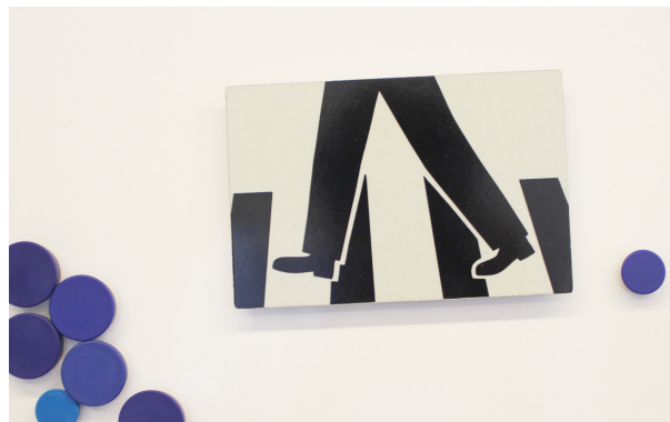
Ein Magnet auf die Rückseite geklebt und Ihre Erinnerung bleibt haften.