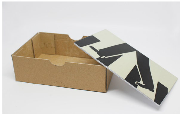
Eine Aufbewahrungsbox für Krimskrams? Auf Seite 2 gibt es den Bastelbogen dazu.