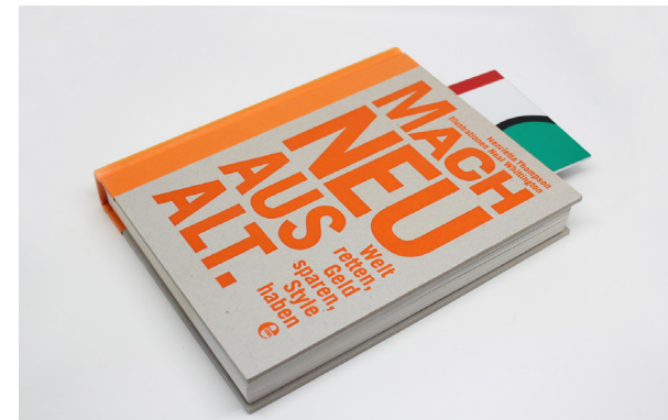
Setzen Sie ein Buchzeichen.